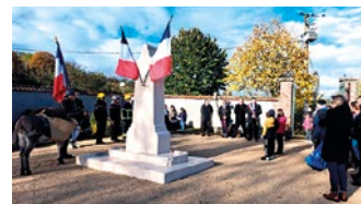
Vue d'ensemble où de nombreux néoviciens ont rendu hommage aux soldats morts pour la France.