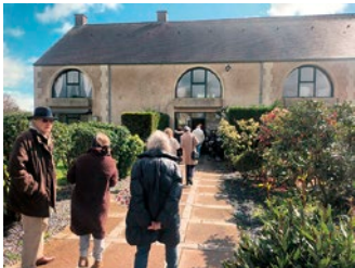
Un repas convivial au golf d'ableiges.