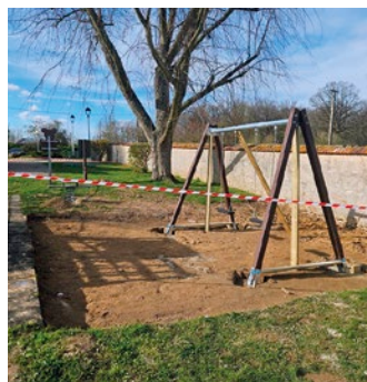
... ainsi que de la balançoire.