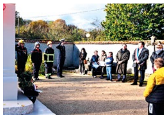
Photo avec les pompiers, militaire ainsi que le maire avec des conseillers municipaux.