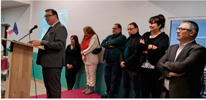
Les conseillers municipaux autour de M. le Maire.