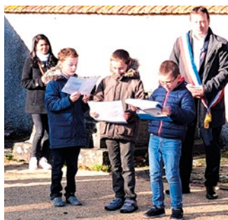
Lecture d'une lettre d'un poilu.