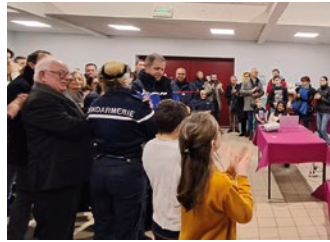
Avec l'agréable présence de la gendarmerie et des pompiers.