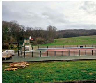
Début du chantier du stade...